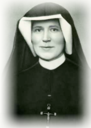
Hl. Schwester Maria Faustina Kowalska (1905 - 1938)

Jesus diktierte Schwester Faustina die Anliegen dieser Novene, die am Karfreitag beginnt, für die Vorbereitung auf das «Fest der göttlichen Barmherzigkeit.» „Ich wünsche“, sagt der Herr, „dass du während dieser neun Tage Seelen an die Quelle Meiner Barmherzigkeit führst, damit sie dort Kraft, Mut und Gnade für dieses Leben und besonders für die Todesstunde finden. Im Verlauf dieser Andacht vergebe Ich Gnaden aller Art. Für diese Seelen sollst du an neun Tagen den Barmherzigkeitsrosenkranz beten.“