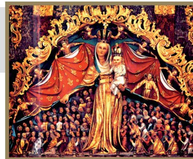
Die Schutzmantelmadonna von Maria Neustift