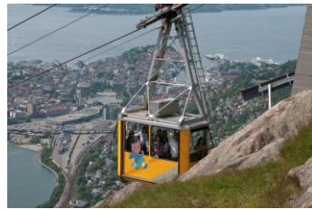
CH - Visitnorway.com

Vom Aussichtsberg Floyen bieten sich fantastische Blicke über die zweitgrößte und vielleicht auch schönste Stadt Norwegens.