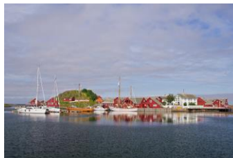
CH - Visitnorway.com

Eine weitere spektakuläre Straße steht heute auf dem Programm. Die Atlantikstraße führt an der Grenze von Festland und Atlantik über elegant geschwungene Brücken von einer kleinen Insel zur nächsten. Man hat förmlich das Gefühl über das Meer zu fliegen!