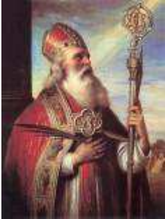
Der heilige Adalbert von Prag.