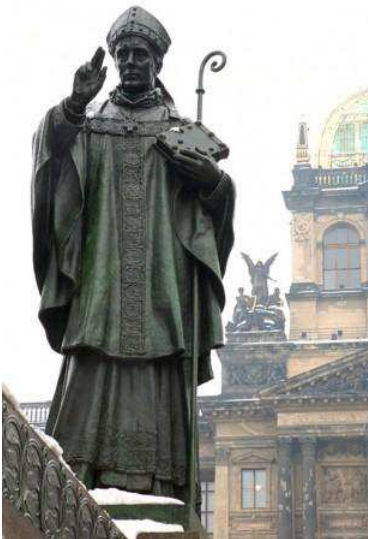
Adalbert von Prag. Teil des Wenzelsdenkmals auf dem Wenzelsplatz in Prag.

Der polnische Papst, der zum Jahresende 1980 die Slawenapostel Cyrillus und Methodius zu Konpatronen Europas erklärt und damit die Slawen wieder nach Europa zurückgeführt hatte, sah die Größe des hl. Adalbert in seinem Wirken für Europa am Ende des ersten Jahrtausends. Die Kirche bereitete sich deshalb in den Jahren des ausgehenden zweiten Jahrtausends auf Wunsch des Papstes intensiv auf das Jahr 2000 vor. In allen deutschen Diözesen wurden bereits eigene Beauftragte für die Durchführung dieses Jubiläumsjahres ernannt. Es sollten zwei Jahrtausende Kirchengeschichte in ihrer Rückblende erfasst und Vorbereitungen getroffen werden, damit die Kirche optimistisch in ein drittes Jahrtausend gehen kann. Auch vor 1000 Jahren stand die Christenheit, die damals noch nicht geteilt war, vor der Feier der Jahrtausendwende. Damals wurde das neue Jahrtausend auch mit apokalyptischen Befürchtungen erwartet, aber auch mit großen Hoffnungen, denn die letzten Jahre des ersten Jahrtausends waren auch Sternstunden einer Entwicklung zur Einheit Europas. Das gilt vor allem für die letzten Lebensjahre des Hl. Adalbert 996 und 997 .