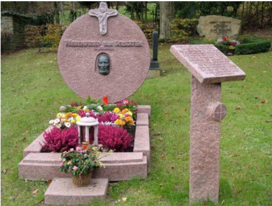
Grab von Pater Werenfried in Königstein im Taunus.

Sie sind Erben von Pater Werenfried. Was erben Sie von ihm? – Das Vorrecht, so ungebrochen an Gott und seine Reichtümer zu glauben, um dann so selbstlos den Menschen zu helfen und zu dienen, dass sie zu ihren Gunsten arm werden.