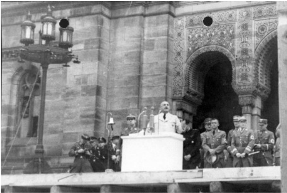
Julius Streicher erteilt Befehl zum Synagogen-Abbruch vor Nürnberger Hauptsynagoge, 10. August 1938.

Jahr für Jahr mehrten sich Einschränkungen und Verbote. 1938 wurden bereits Synagogen demoliert und zerstört und Juden bestimmte Vornamen verboten. Da im selben Jahr der Anschluss Österreichs und des Sudetenlandes an das Deutsche Reich erfolgte, wurden alle diese Unterdrückungsmaßnahmen dort übernommen, wie die Reichspogromnacht vom 9... November zeigt, die im Wörterbuch der Unmensen zynisch als „Reichskristallnacht“ bezeichnet wird, weil in jener Nacht Tausende von Wohnungen und Geschäfte jüdischer Mitbürger demoliert wurden. Am 10. November 1938 meldete Reinhard Heydrich an Hermann Göring: „An Synagogen wurden 191 in Brand gesetzt, weitere 76 vollständig demoliert. Ferner wurden 11 Gemeindehäuser, Friedhofskapellen und dergleichen in Brand gesetzt und weitere drei völlig zerstört. Festgenommen wurden rd. 20.000 Juden. An Todesfällen wurden 36, an Schwerverletzten ebenfalls 36 gemeldet. Die Getöteten bzw. Schwerverletzten sind Juden.“ Das Abtragen der zerstörten Synagogen mussten die jüdischen Gemeinden bezahlen, außerdem gab es keinerlei Versicherungsleistungen für die 7.500 zerstörten Geschäfte. Im Gegenteil mussten die jüdischen Gemeinden eine „Sühneleistung“ von einer Milliarde Reichsmark für den Tod des am 7. November erschossenen Legationssekretärs vom Rath aufbringen.