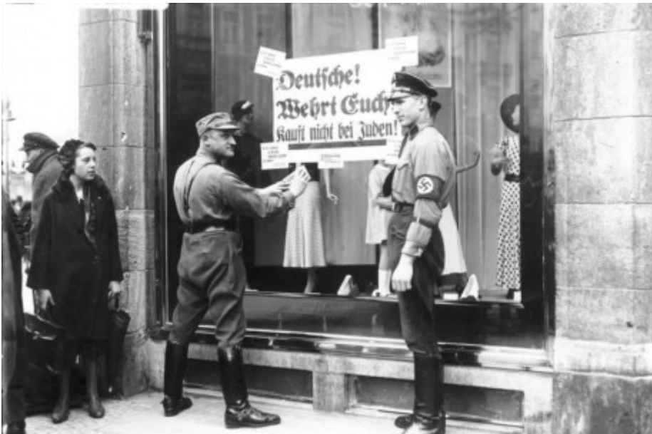
Berliner SA-Männer beim Anbringen von Plakaten, die zum Boykott jüdischer Geschäfte aufrufen, am 1. April 1933.