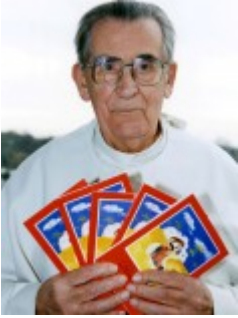
Pater Werenfried van Straaten mit einigen Ausgaben der Kinderbibel (Foto: Balz Röthlin).

„Vater“ der Kinderbibel war der niederländische Prämonstratenser Pater Werenfried van Straaten (1913-2003), der Gründer von KIRCHE IN NOT.