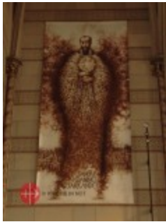
Bildnis des hl. Sarkander im Olmützer Wenzelsdom

Im Jahre 1995 hat Papst Johannes Paul II. in Olmütz mit Johannes Sarkander einen Märtyrer heilig gesprochen, der auch oft zusammen mit dem heiligen Johannes Nepomuk dargestellt wird. Den heiligen Johannes Nepomuk, der auch in Deutschland auf vielen Brücken steht, kennt jeder. Aber Johannes Sarkander?